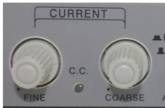
Current FINE / COARSE adjustment knob Steady flow indicator