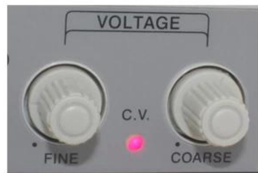
Voltage FINE / COARSE adjustment knob Regulators indicator