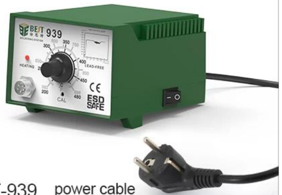
BST-939 power cable