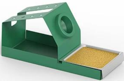
Soldering Iron frame