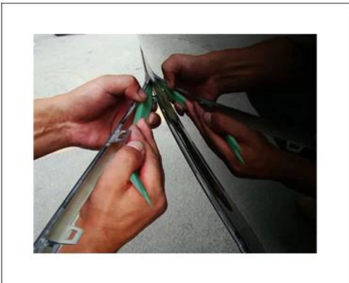
"S" Pry plate