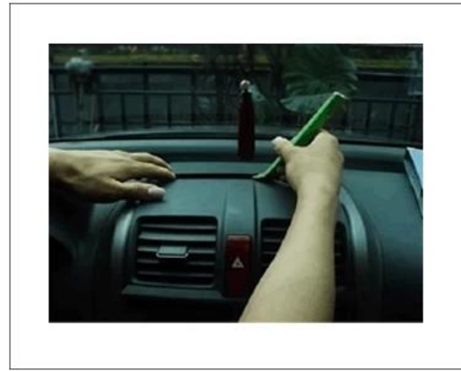
Medium pry plate