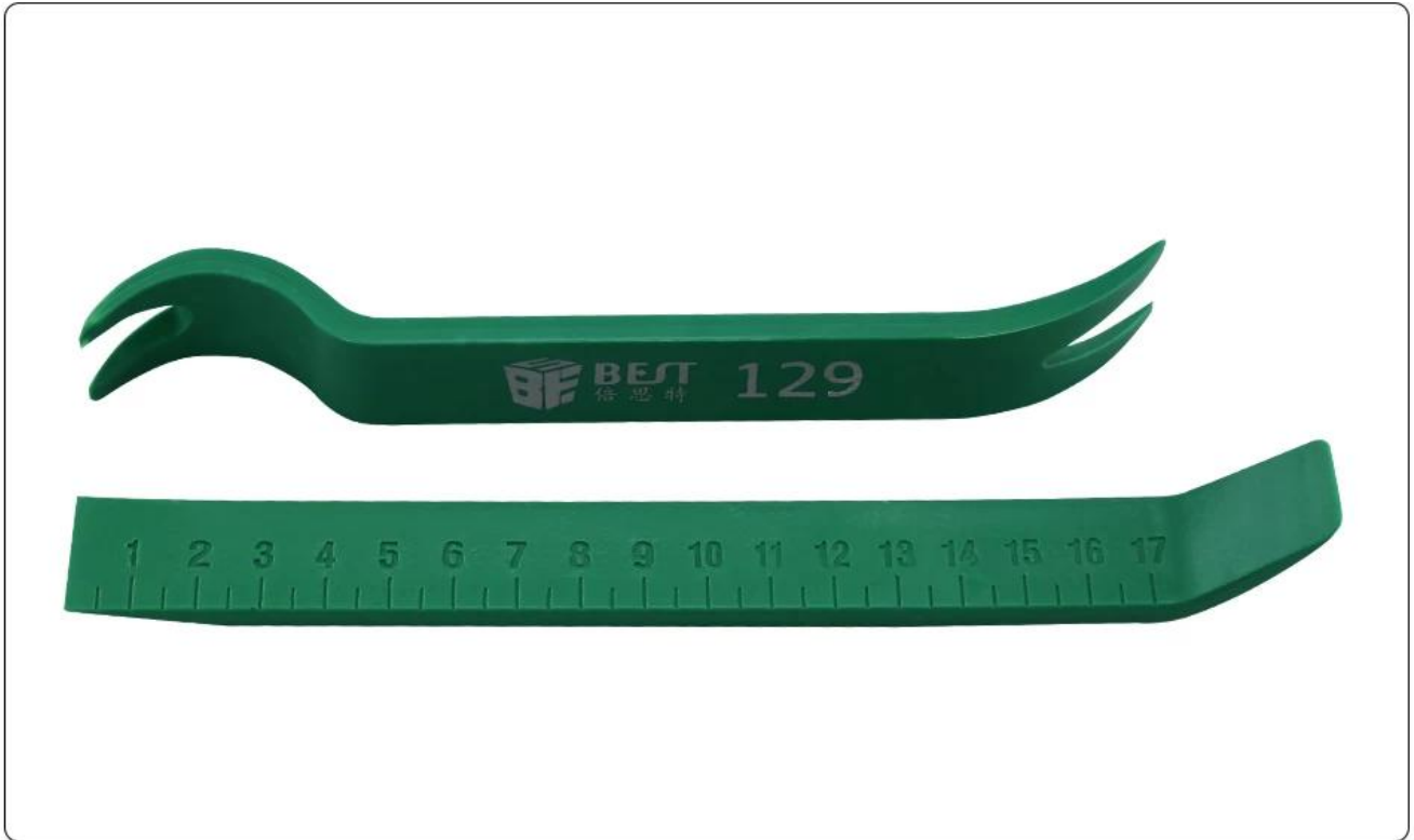
Medium pry plate