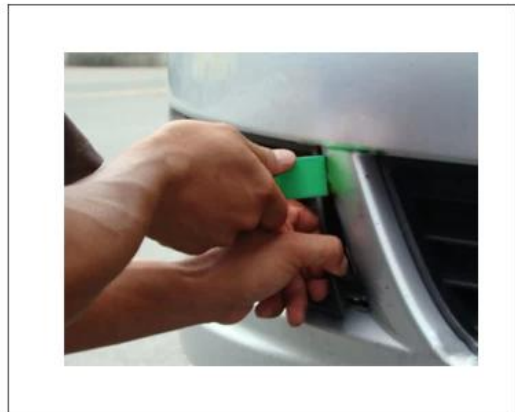
"S" Pry plate