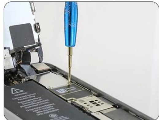
disassemble internal screw