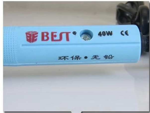
Environmental protection plastic