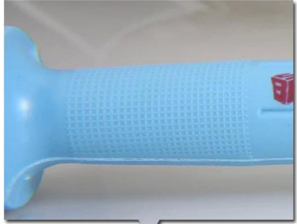
Carved stripes ,Anti-slip designed