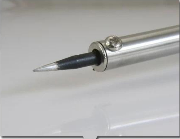
Alloy tip, fast heat transfer, not easy to ablate and easy to replace