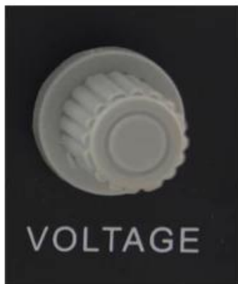
Voltage output / input mode conversion

After power on, press the switch is turned on to work, close to stop working