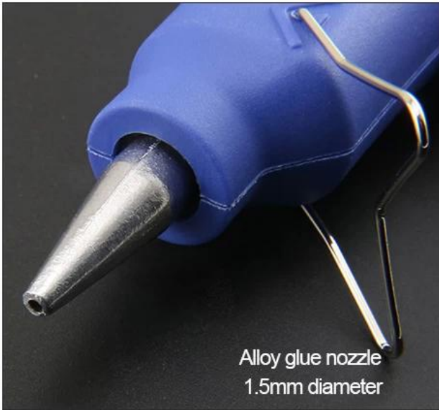
Alloy glue nozzle 1.5mm diameter