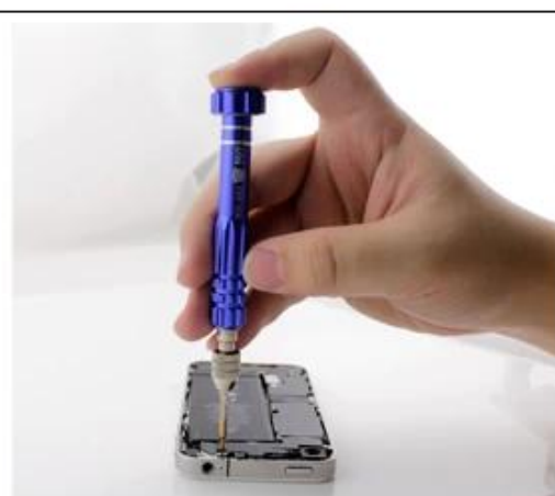
铝材刀柄，手感舒适 拿捏方便，防滑设计