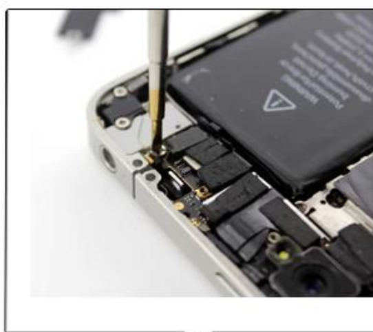
一字2.0可拆iphone4、iphone4S iphone5的内部螺丝