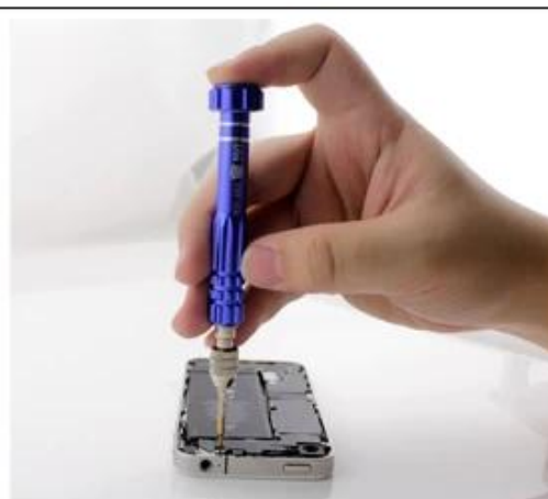
Aluminum handle, feel comfortable; moderation convenient, non-slip design