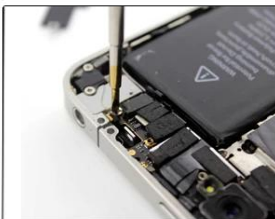
Word 2.0 Detachable iphone4, iphone4S iphone5 internal screw