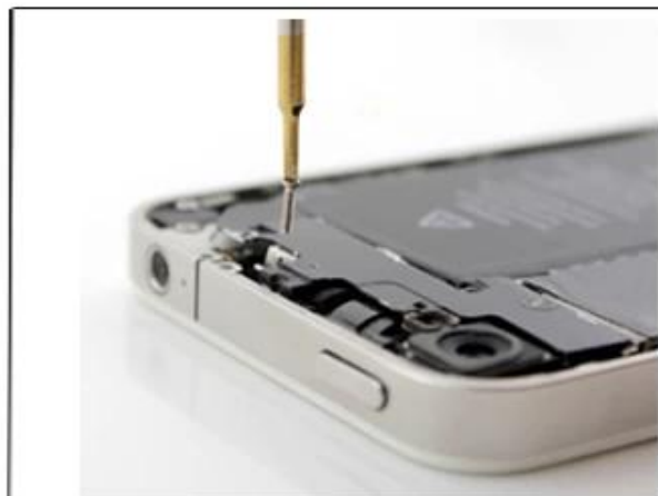
PH000 removable iphone4, iphone4S iphone5 internal screw