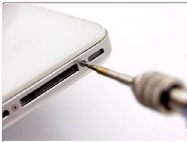
★ 0.8 Detachable iphone4, iphone4S iphone5 the bottom of the screw