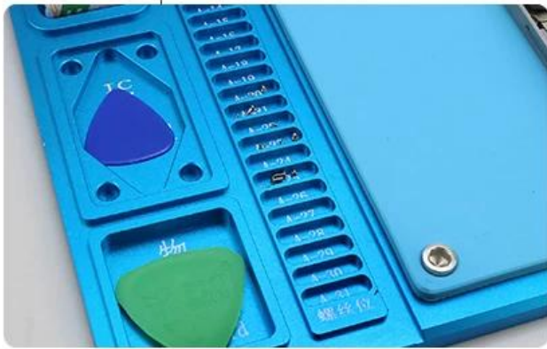
A variety of screws to prevent loss Material: aluminum alloy