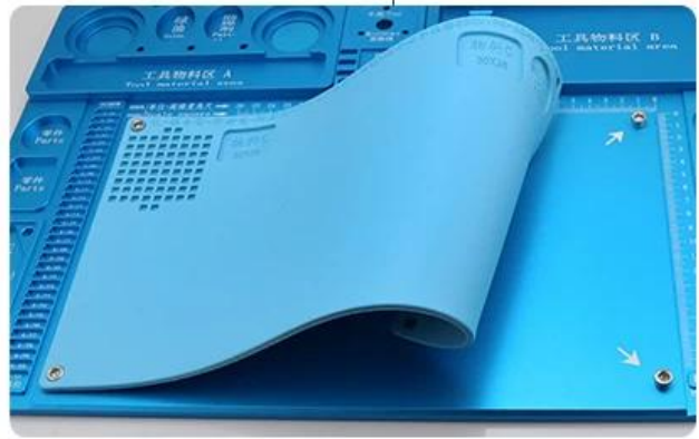
High temperature resistant silica gel pad