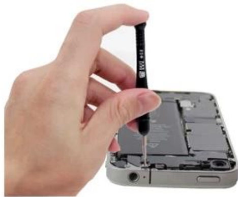
螺丝刀：拆内部螺丝

★0.8螺丝批（iPhone4/4s/5/5s专用）、一字2.0螺丝批（iPhone3及iPhone4部分专用）、十字1.5螺丝批（iPhone3/4/5专用）